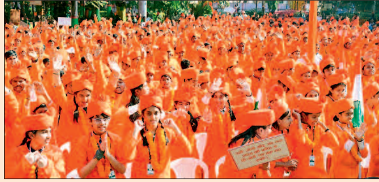
स्वामी विवेकानंद पर लगी प्रदेशी का किया अवलोकन : उप मुख्यमंत्री अरुण साव ने स्वामी विवेकानंद उद्यान बिलासपुर में स्वामी विवेकानंदजी के जीवन पर आधारित ज्ञानवर्धक प्रदर्शनी का केंद्रीय राज्य मंत्री तोखन साहू जी के साथ अवलोकन किया। उद्यान में यह प्रदर्शनी लगी रहनेगी। यहां पहुंचकर बिलासपुर के नागरिक विवेकानंदजी की जीवनी से प्रेरणा लेंगे। इस अवसर पर श्री साव ने उद्यान में विवेकानंद जी की प्रतिमा पर माल्यार्पण कर आशीर्वाद प्राप्त किया।