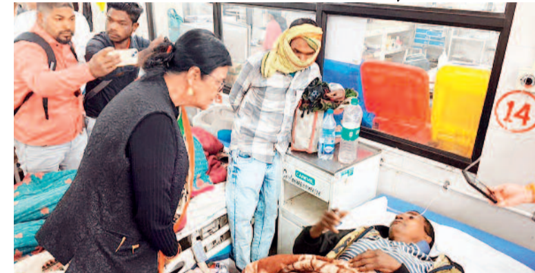
सांसद पहुंची अस्पताल

धान बेचने के लिए राज्य सरकार के द्वारा शुरू की गई ऑनलाइन सुविधा में धान बेचने के लिए टोकन नहीं कटने से परेशान किसान ने आज जहर खा लिया। परिजनों के द्वारा उपचार के लिए जिला चिकित्सालय में दाखिल कराया गया है। किसान द्वारा रकबे के रिकार्ड में सुधार करने के लिए तहसील में आवेदन लगाने के बाद भी कार्यवाही नहीं होने पर भी जनदर्शन में भी आवेदन दिया गया था। जहां सुनवाई नहीं होने की स्थिति पर हताशा किसान ने घर में रखा कौटनाशक पदार्थ खा लिया। इस घटना से प्रशासनिक महकमे में हड़कंप मच गया है। मामले में तहसीलदार को नोटिस दी गई है और पटवारी को निलंबित कर दिया गया है। आनन फानन में जांच टीम भी गठित की गई है।